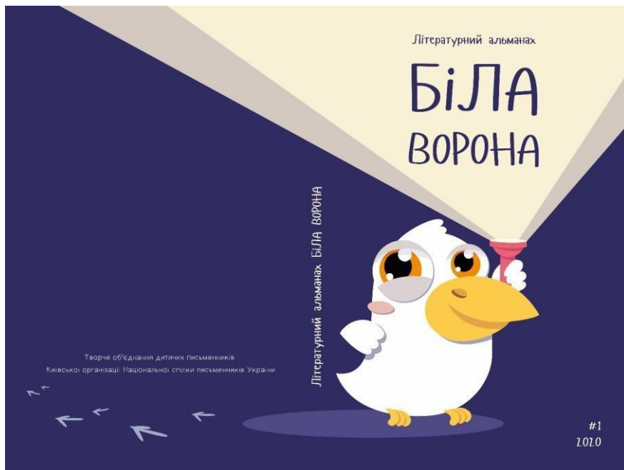
Рисунок 2.3. Варіант оформлення обкладинки видання