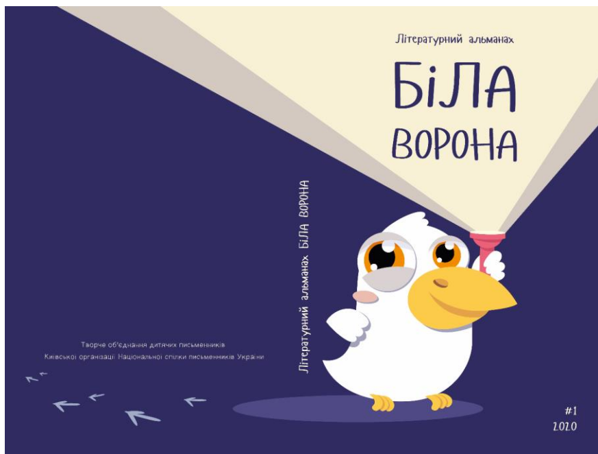
Рисунок 2.3. Варіант оформлення обкладинки видання